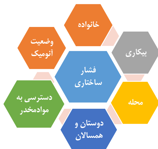
شکل ۲. نمودار انواع فشار ساختاری و عوامل تشدیدکننده