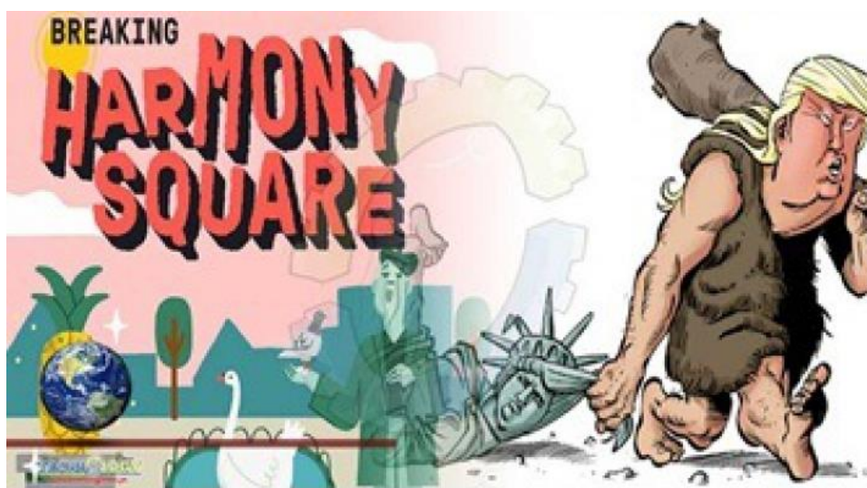
شکل ۲. صفحه عنوان بازی خبری هارمونی اسکوئر