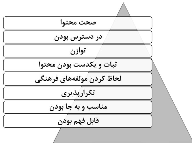
شکل ۱: ویژگی‌های پیام سلامت (مرکز کنترل و پیشگیری از بیماری‌های آمریکا، ۲۰۲۰)