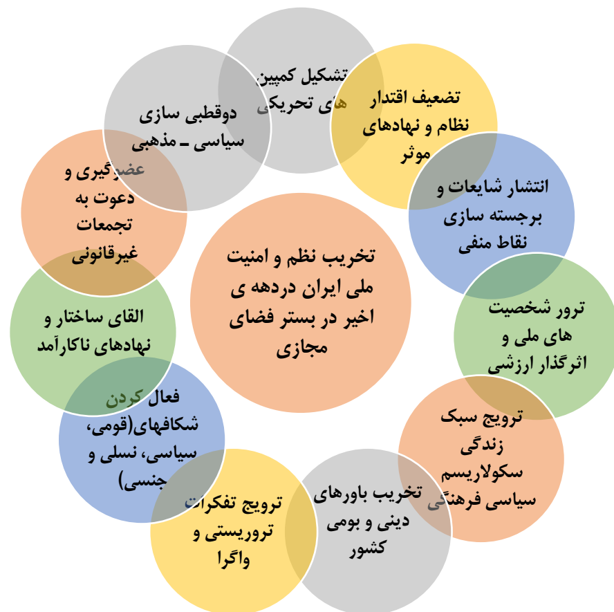
شکل (۵) یافته های تحلیلی ارتباط شبکه های اجتماعی با نظم ملی جمهوری اسلامی ایران (یافته های نگارندگان)

با توجه به بررسی های انجام شده در زمینه تغییرات جدید در زندگی انسان های مدرن، اکثر نظریه پردازان بر این نکته تأکید دارند که تحولات در حوزه رسانه ها به ویژه شبکه های اجتماعی و اینترنت، تأثیرات عمیقی بر حکمرانی و روابط میان شهروندان داشته است. در این زمینه، نظم و امنیت سیاسی و اجتماعی نیز تحت تأثیر قرار گرفته است. ظهور فناوری های رسانه های اجتماعی موجب تغییر روش های ارتباطی میان مردم، سازمان ها و نهادهای دولتی شده و همچنین تعامل میان دولت و شهروندان را به مراحل جدیدی وارد کرده است. این تغییرات به همراه خود فرصت ها و چالش هایی برای فرآیند حکمرانی و نظام تصمیم گیری ایجاد کرده است. در این راستا، بحث درباره چالش های فرهنگی و تمدنی حکمرانی جمهوری اسلامی و حکمرانی های دیگر، نشان دهنده استفاده از ابزارهای مختلف برای تضعیف و کاهش اقتدار ملی جمهوری اسلامی ایران در دو دهه اخیر است. به ویژه، تحرکات اجتماعی و خیابانی در سال های اخیر به عنوان نمونه ای عینی از این تلاش ها برای مختل کردن امنیت و نظم پایدار کشور به نظر می رسد. این وضعیت، نیاز به بررسی دقیق تر و تحلیل عمیق تری از تحولات رسانه ای و تأثیرات آن بر حکمرانی و جامعه را بیش از پیش نمایان می سازد. در جدول زیر مهم ترین محورهایی که در شبکه های مجازی علیه نظم و امنیت داخلی جمهوری اسلامی ایران به کار گرفته شد، اشاره می شود: