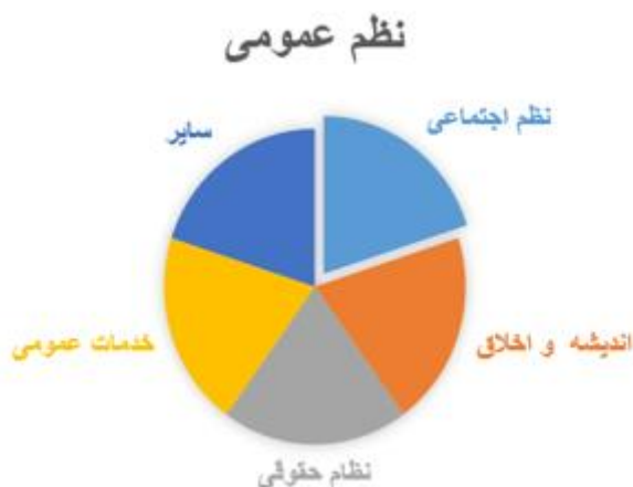
شکل (۱) بخش‌های مختلف نظم عمومی (نگارندگان)

این مقوله در مناسبات اجتماعی بستگی دارد. در تحقق یا شکست این چشم‌انداز، مؤلفه‌هایی چون منافع ملی و چشم‌انداز بلندمدت، تناسب زمان و مکان، ساختار سیاسی، روحیات و خلیات فردی، شرایط اجتماعی و تغییرات در دیدگاه‌های فکری موجود در جامعه مؤثر هستند (موسوی مجاب، ۱۳۹۸، ۱۴)؛ بنابراین می‌توان نظم عمومی را شامل مواردی مانند نظم اجتماعی، اخلاق، خدمات عمومی و... دانست.