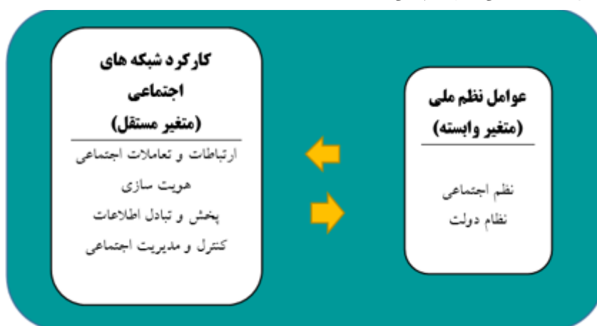
شکل (۲) الگوی تحلیل برای ارتباط نظم ملی و شبکه‌های اجتماعی (نگارندگان)

با توجه به مفهوم‌شناسی مؤلفه‌های مذکور، پخت تحلیل و تبیین عمیق و دقیق مسئله نیازمند ترسیم مدل مفهومی و الگوی تحلیل پژوهش هستیم. بر اساس مطالبی که گفته شد، نظر نگارندگان آن است برای بررسی رابطه شبکه‌های اجتماعی بانظم ملی باید تأثیر کارکرد شبکه‌های اجتماعی را بر نظم ملی و دو بخش ذیلش یعنی نظم اجتماعی و ساختار و نظام دولت سنجید. منظور آن است که باید دید که هویت‌سازی، تعاملات اجتماعی، تبادل اطلاعات و کنترل و مدیریت اجتماعی چه رابطه‌ای بانظم اجتماعی و ساختار دولت دارند. شکل شماتیک این نظر در پایین آمده است: