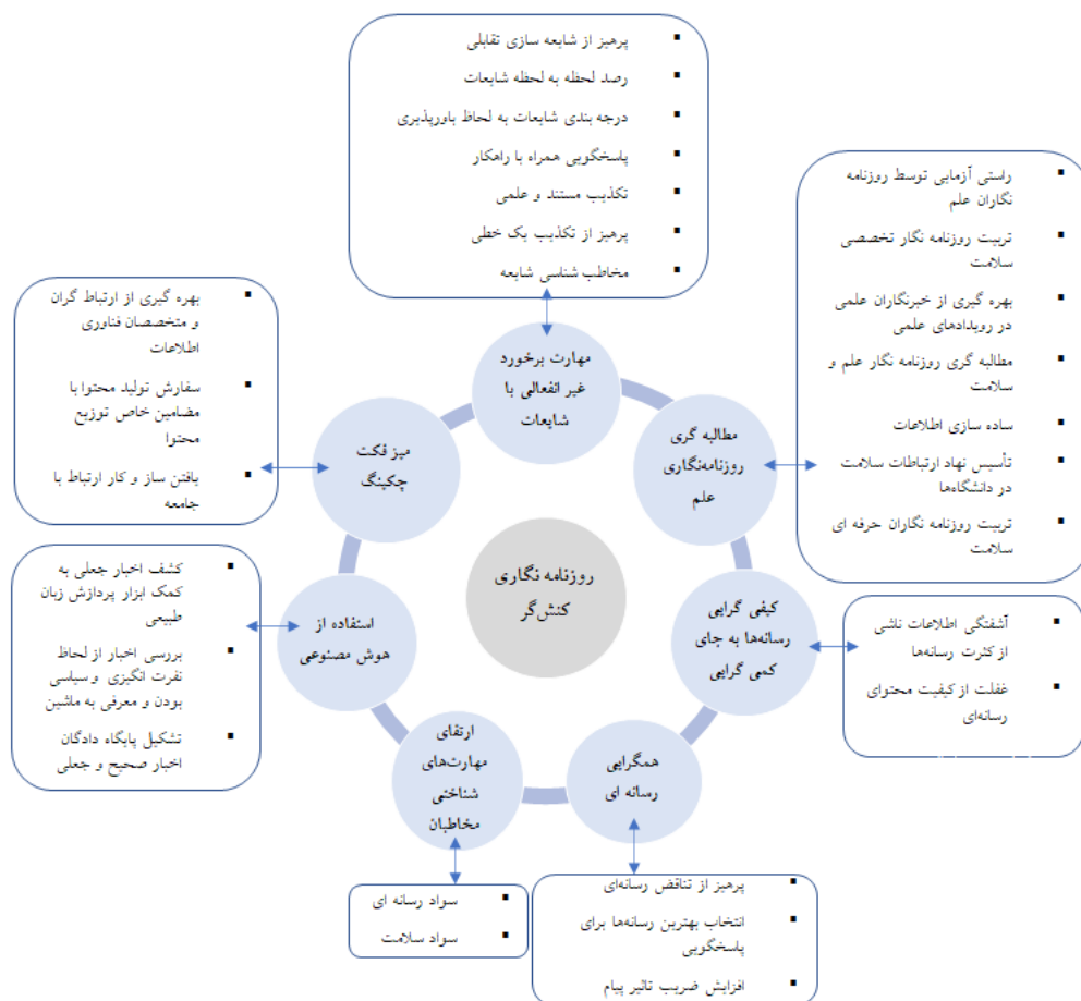
شکل ۲- مضامین شناسایی شده برای روزنامه‌نگاری کشف‌گر

در دستور کار قرار داد: مطالبه‌گری روزنامه‌نگاری علم، تشکیل میز فکت چکینگ، استفاده از هوش مصنوعی، مهارت برخورد غیر انفعالی با شایعات، کیفی‌گرایی رسانه‌ها به جای کمی‌گرایی، همگرایی رسانه ای و ارتقای مهارت‌های شناختی مخاطبان.